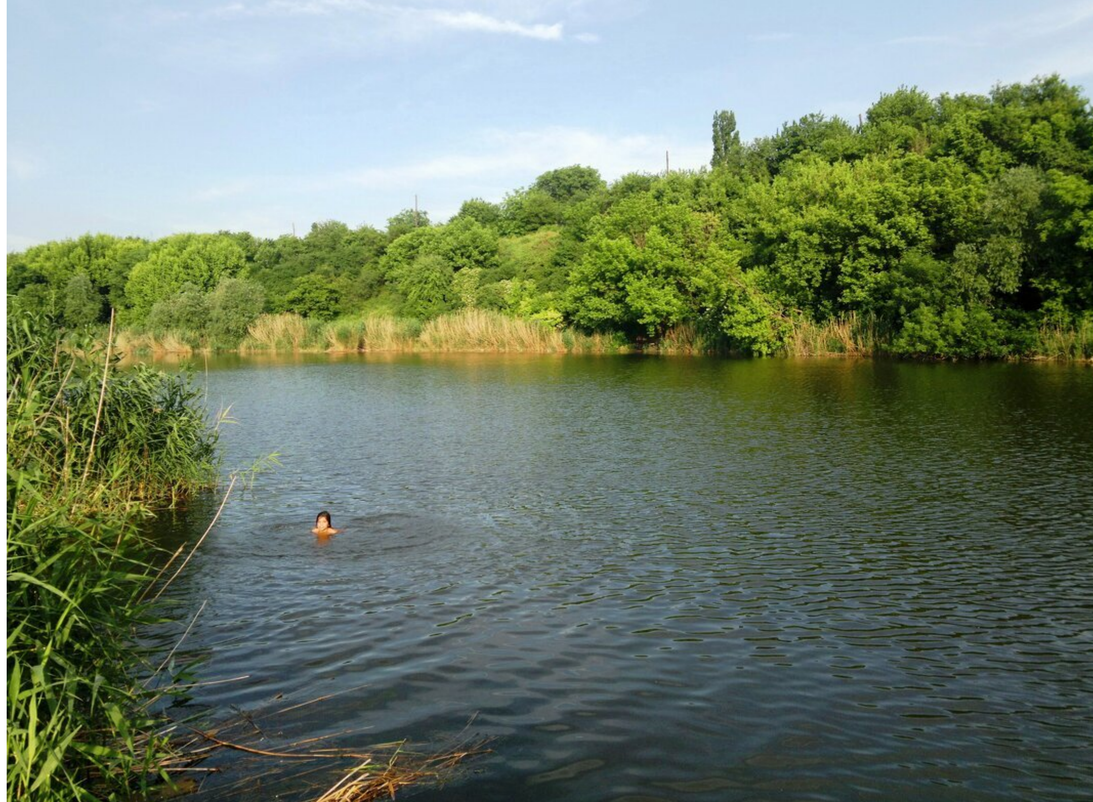
Лисичкино озеро.